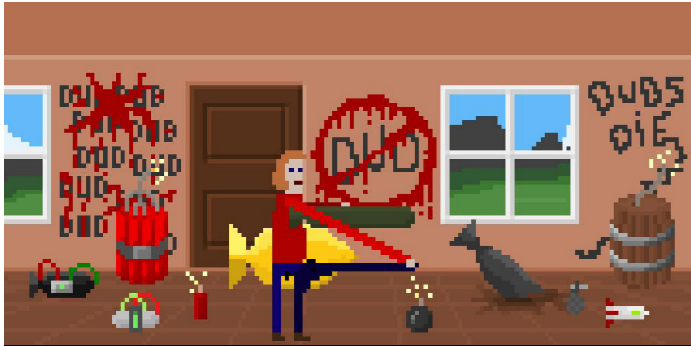
Obrázok 1: Záber z hry McPixel