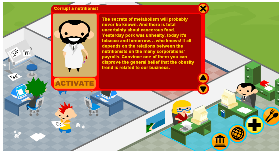
Screenshot z hry McDonald's. Hráč zde má volbu zkorumpovat nutričního poradce, aby doporučoval nezdravé jídlo z řetězce.

skupiny Molleindustria . Tu označuje za antireklamní, protože se snaží známý fast-foodový řetězec spíše poškodit, než jej podpořit. Cílem hráče je řízení celého tohoto řetězce tak, aby síť restaurací profitovala. Hráč musí řídit celý obchodní model. Obstarává co nejlevnější suroviny, stará se o chod restaurací, řídí marketing i PR. Přitom musí dělat nejen mnohá obtížná obchodní rozhodnutí, ale především rozhodnutí morální. Hráč (stejně jako kritizovaná síť restaurací McDonald's) je ve svém rozvoji limitován v mnoha směrech – dostupnou půdou, na které se pase dobytek, rychlostí růstu zvířat, cenou za náklady na krmivo pro zvířata atp. Hráči jsou však dostupné metody jako podplácení, využívání růstových hormonů, možnost užívat nezdravá a nekvalitní krmiva pro zvířata atp. Herní obchodní model je přitom nastavený tak, že hráč jednoduše nemůže být ve hře úspěšný (zajistit firmě profitabilitu), pokud takové metody nepoužívá.