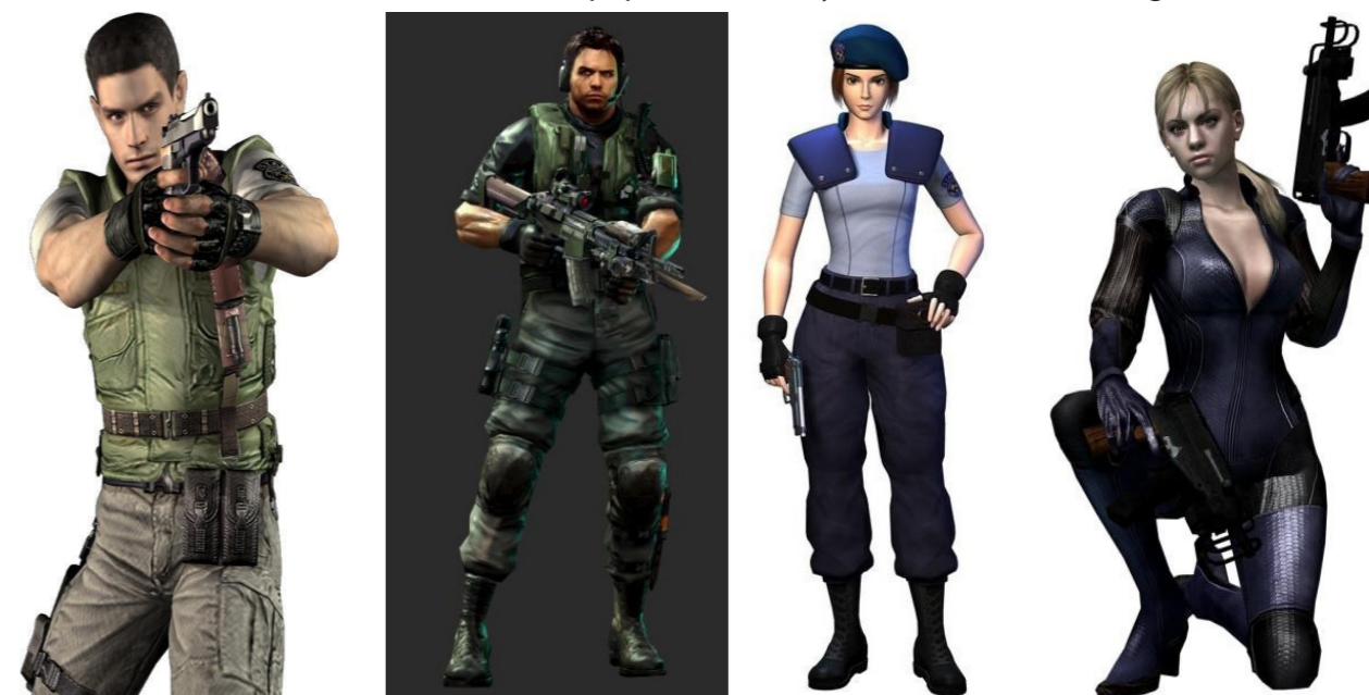
Obr. 2, 3, 4 a 5 – Proměna Chrise Redfielda (Resident Evil 1 z roku 1996 a Resident Evil: Revelation z roku 2012) versus Jill Valentine (opět Resident Evil 1 a Resident Evil 5 roku 2009).

dokonce udělat delší krok. Při snaze o pochopení funkce ženského oblečení se pak stačí podívat na proměnu, kterou Jill prošla až do Resident Evil 5 (platinové vlasy, latexová kombinéza). Oblečení se tak stává jednou ze zbraní – často si tak hráč po prvním dohrání může u ženských postav vybrat nový kostým, stejně jako je u těch mužských k dispozici nová zbraň (Resident Evil 2, Lollipop Chainsaw, Bayonetta, Tomb Raider: Legend).