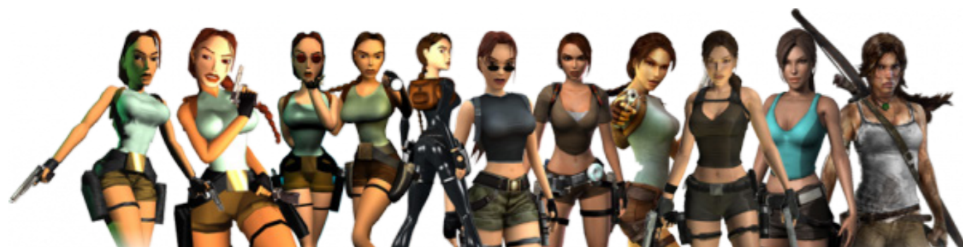
Obr. 1: Evoluce Lary Croft. Mění se k „lepšímu“?

nebo Juliet Starling (Lollipop Chainsaw). Následující řádky se ale dají do určité míry aplikovat na všechny hratelné (ženské) postavy.