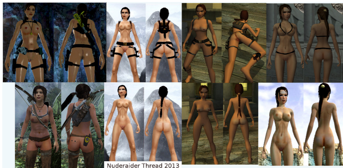
Obr. 6 – Nude Raider patch, díky kterému Lara pobíhá v rámci hry nahá – existuje nebo ne?

třeba patří ženě – je jednoduše kódován maskulinně. V případě počítačových her je situace onoho pohledu o to specifičtější, že hráč onu postavu, předmět skopofilní touhy, přímo ovládá. Ženská hrdinka tak sice působí dominantně a silně, ale v kontextu hraní počítačových her je ztělesněním mulveyovského „bytí pro pohled“. Hráč totiž (ženskou) postavu skutečně ovládá a rozhoduje, kdy zemře a jaký pohyb udělá. Už samotná „kamera“ v počítačových hrách takový pohled naznačuje – záběry často začínají pohledem na pozadí ženských postav, pokračují přes jejich boky nebo řadra. Jakoby tyto objektivní prvky, které jsou zakódovány přímo do herní mechaniky a nejsou rozhodnutím hráče, podporovaly onen voyeuristický apel. „Slídíme za Larou, když je sama v jeskyni (...). Je reflektována pouze přes vaše oči, my sami jsme neviditelní“ (Poole, 2000: 145).